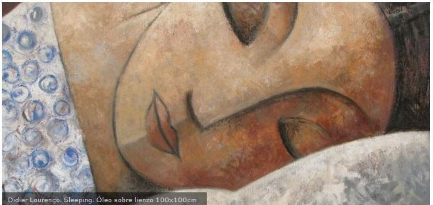
Didier Lourenço. Sleeping, Óleo sobre lienzo 100x100cm